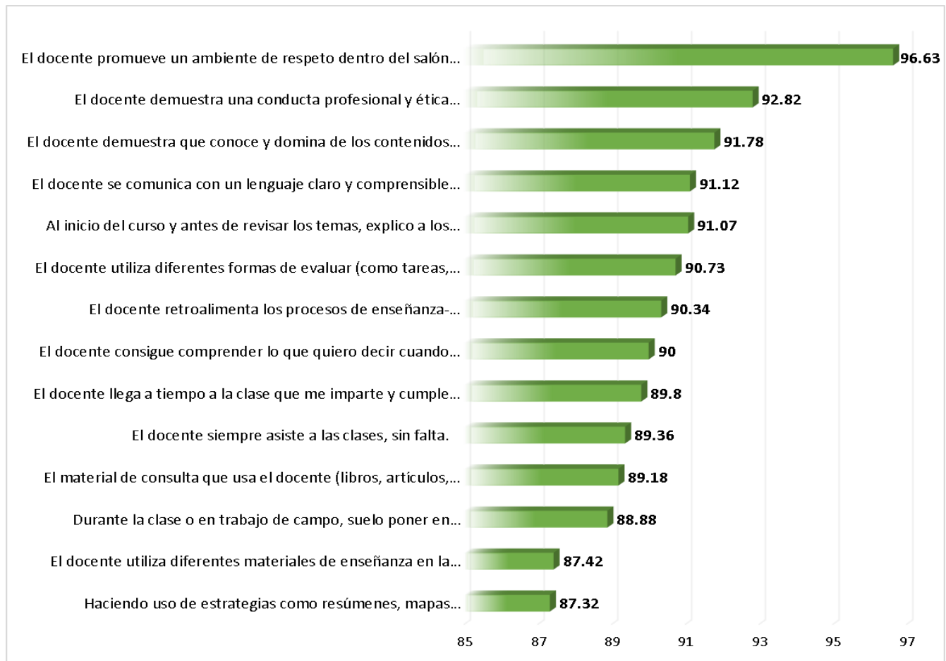
Gráfica 3. Promedios Generales por Reactivo de la Encuesta. DCS. Farmacia.

Promedios generales que obtuvieron en cada uno de los reactivos del cuestionario.