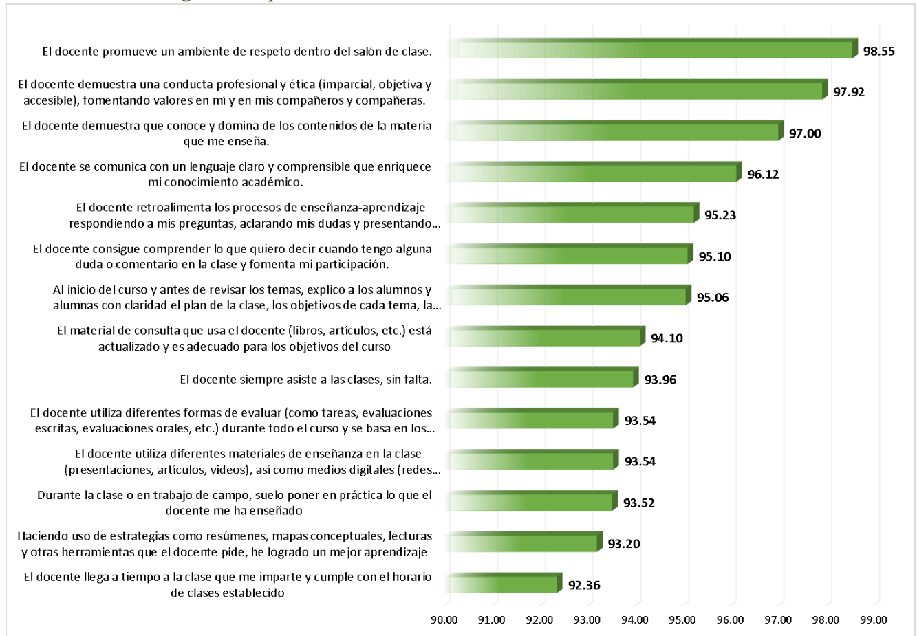
Gráfica 2. Promedios Generales por Reactivo de la Encuesta. DCS. Enfermería.

Promedios generales que obtuvieron en cada uno de los reactivos del cuestionario.